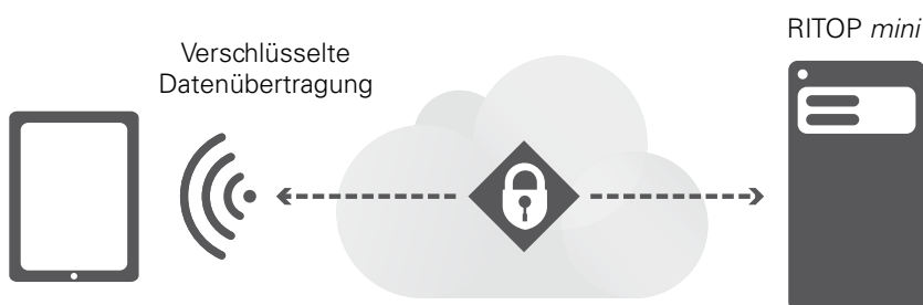
Der Zugriff auf RITOP mini erfolgt passwortgeschützt mit dem inkludierten Tablet. Eine verschlüsselte Verbindung zum Leitsystem schützt vor unerwünschten Eindringlingen. Voraussetzung ist ein bestehender Internetanschluss auf Kundenseite.

Dank automatisierter Updates bleiben Betriebs- und Leitsystem immer auf dem neuesten technologischen Stand. Alle Daten sind redundant gehalten, mehrfach gesichert und werden gesetzeskonform behandelt. Jeden Monat erhalten Sie automatisch einen umfassenden Bericht mit allen relevanten Informationen. Backups, professionelles Patch-Handling sowie die Integration neuer Funktionalitäten erledigen wir ebenfalls zentral und ohne jeden weiteren Aufwand für Sie.